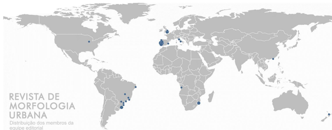
Figura 3. Refletindo a rede lusófona no mundo e suas conexões: distribuição geográfica dos membros do Conselho Editorial da RMU para o triênio 2019-2022.