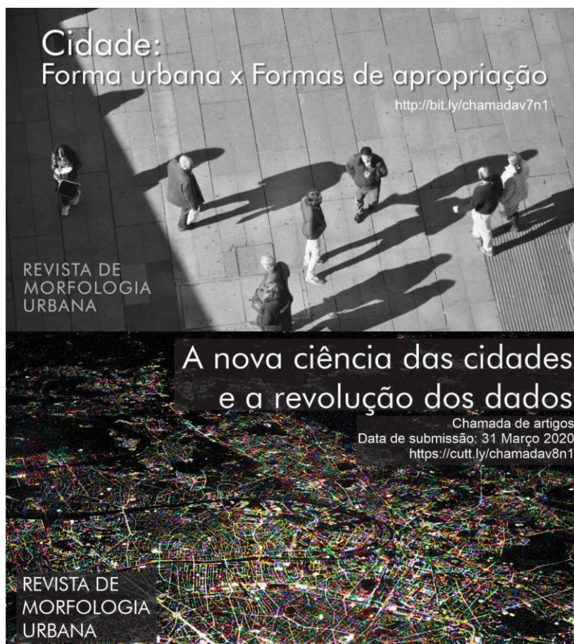
Figura 4. Edições temáticas da RMU.

chamadas de artigos) têm o poder de difundir temas e reforçar a presença do periódico no campo como veículo relevante, voltado à publicação de artigos que contribuam para avançar o estado da arte nesses temas (figura 4). De fato, nossas duas chamadas adicionaram um considerável número de artigos às edições da RMU.