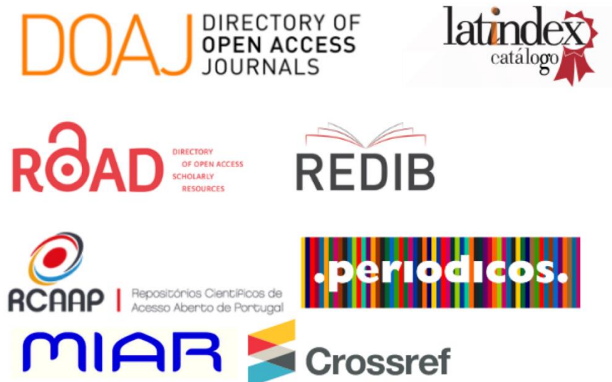
Figura 5. As indexações em bases científicas conquistadas pela Revista neste triênio.

Entre as outras ações realizadas nesses três anos, ainda estão: