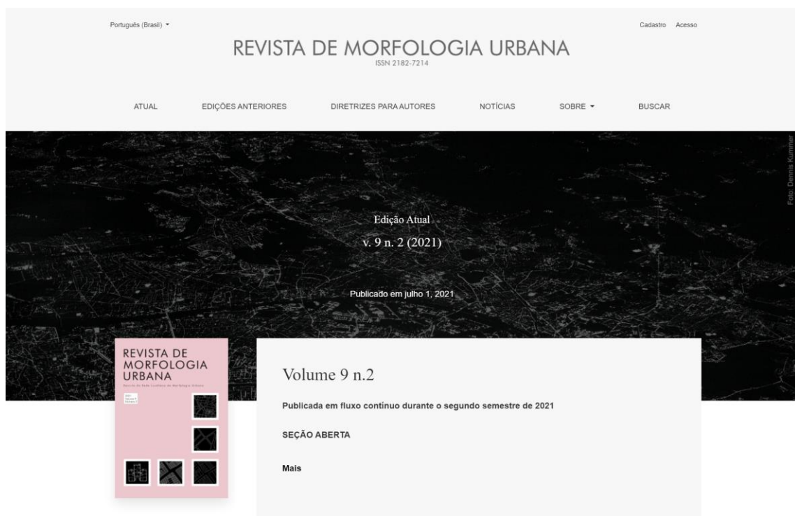
Figura 2. Interface do novo website da Revista de Morfologia Urbana.

mais eficiente e, ao mesmo tempo, uma interface pública de visual agradável e alta funcionalidade (figura 2), incluindo buscas ao acervo, divulgação de notícias e chamadas para edições temáticas, visualização de estatísticas de acesso e formatação automática das citações aos artigos.